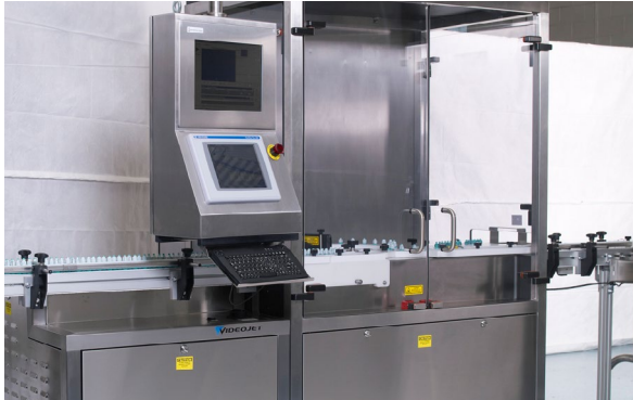
Solución de envasado de FP Developments con la instalación del láser UV de Videojet.

Videojet trabajó estrechamente con FP Developments para garantizar la correcta integración de los láseres UV en su equipo de envasado. Con más de 50 años de experiencia en el diseño de maquinaria de envasado, FP Developments creó una solución que proporcionaba una manipulación del material muy eficiente, un prerequisite para el marcaje de códigos DataMatrix de alta calidad a la velocidad de producción de la línea especificada. Además, el software del láser UV de Videojet incluía compensación del arco como función estándar. Esta función del software aumentó aún más la calidad del código DataMatrix al compensar la trayectoria del producto en el dispositivo de manipulación de materiales giratorio (rueda estrellada). Los requisitos operativos y de codificado varían entre las empresas, por lo que la capacidad de adaptar el sistema con facilidad para cubrir las distintas necesidades es fundamental. Las opciones de configuración y los parámetros definidos por el usuario ayudan a las empresas a alcanzar con sencillez su nivel específico de detección de códigos.